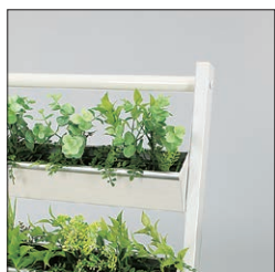
緑と白のさわやかな組み合わせ。