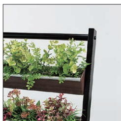
黄色と赤のアクセントがオシャレ。