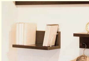
【L型ウォールシェルフ】 サイドにこぼれ止めがついた棚です。本やCDの整理におすすめです。