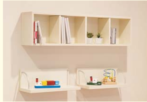
【ウォールBOX】 本やCDの整理に便利なBOX棚です。