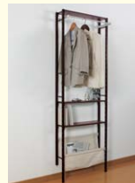
【ユニットシェルフ】 壁に取り付けて使う奥行150mmの薄型シェルフです。