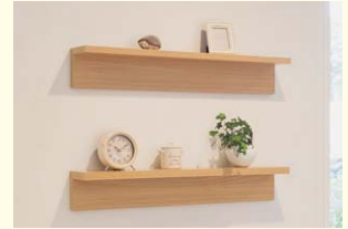
【ウォールシェルフ】 シンプルな壁付け棚です。ちょっとした壁をディスプレイスペースとして使えます。