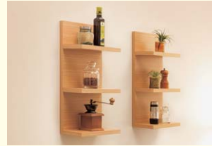
【ウォール3段シェルフ】 小物整理に便利で収納力が魅力です。