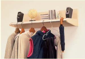
【壁付け天井ラック】 大型の棚にパイプハンガーが付いていて使い勝手がいい棚です。