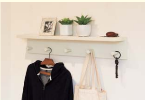
【フック付ウォールシェルフ】 棚にフックが付いているので置いたり掛けたり便利に使えます。